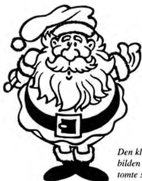
Den klassiska bilden av hur en tomte ska se ut.

samma huruvida vi egentligen haft något tomtebesök. Dessbättre var kanske inte detta huvudsaken just då. Det viktigaste var ju att det samlades några julklappspaket kring var och en av dem som varit "snälla barn" under året. Men om tomteuthyrarna tänkt sig för lite bättre och åstadkommit någorlunda "riktiga tomter", tror jag däremot att det skulle ha blivit en fin upplevelse även om det varit en tomtemor eller tomteflicka.