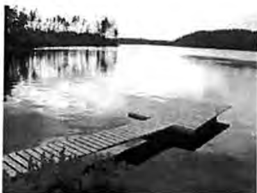
Den färdiga bryggan i skymningen.