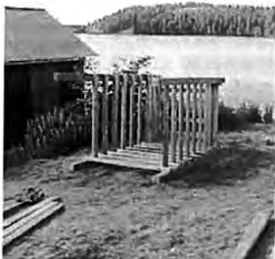
Stommen är klar och snart ska den i sjön.

Under sommaren 2001 byggdes en ny brygga på Stranna. Den blev i form av en stenkista. Nu återstår att se om den kan stå emot isens krafter över vinterhalvåret. Om inte, får jag väl bygga en ny variant nästa sommar.